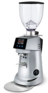
F71 KE pag. 35