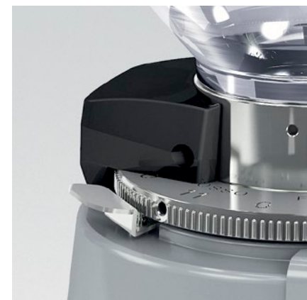
blocco ghiera - blocco campana ring nut lock - coffee bean hopper lock