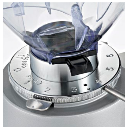
regolatore macinatura micrometrica micrometric grinding adjustment