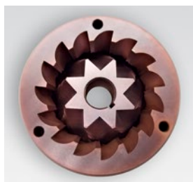
macine red speed / red speed blades